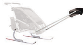
Thule langlauf- en loopkit

Thule Child Transport Systems Ltd. behoudt zich alle rechten op deze handleiding voor. Tekst, gegevens of illustraties uit deze handleiding mogen niet worden gekopieerd, verspreid of zonder toestemming worden gebruikt voor commerciële doeleinden, noch beschikbaar worden gesteld aan anderen.