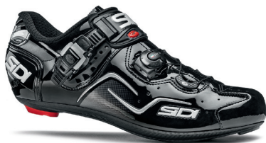
BLACK | BLACK NERO | NERO