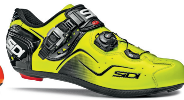
YELLOW FLUO GIALLO FLUO