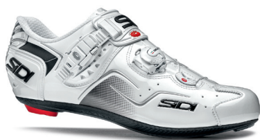
WHITE | WHITE BIANCO | BIANCO