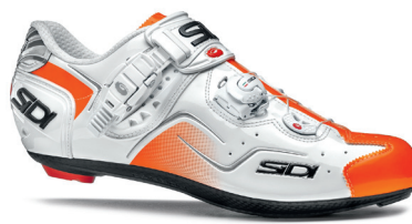
WHITE | ORANGE FLUO BIANCO | ARANCIO FLUO