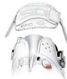
SOFT INSTEP 2

-- E' un cinturino posizionato sul collo del piede, sagomato, morbido e anatomico accoppiato con un materiale soffice per maggior comfort. Distribuisce la pressione in modo omogeneo sul collo del piede e si regola su entrambi i lati per avere una posizione perfettamente centrata del cinturino a seconda che il collo del piede sia basso o alto. Il sistema elimina la necessità di usare un distanziatore. SOFT INSTEP è sostituibile.