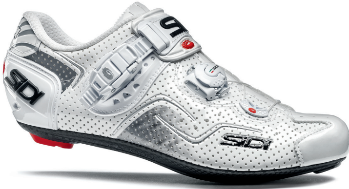
COLOUR | COLORE