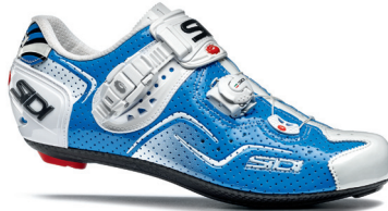
BLUE | WHITE