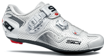
WHITE | WHITE