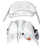
SOFT INSTEP 2

.. E' un cinturino posizionato sul collo del piede, sagomato, morbido e anatomico accoppiato con un materiale soffice per maggior comfort. Distribuisce la pressione in modo omogeneo sul collo del piede e si regola su entrambi i lati per avere una posizione perfettamente centrata del cinturino a seconda che il collo del piede sia basso o alto. Il sistema elimina la necessità di usare un distanziale. SOFT INSTEP è sostituibile.