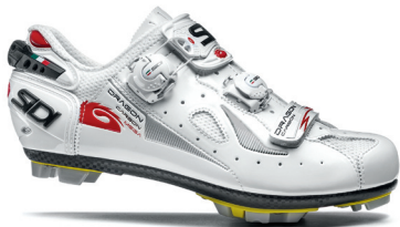
WHITE | WHITE BIANCO | BIANCO