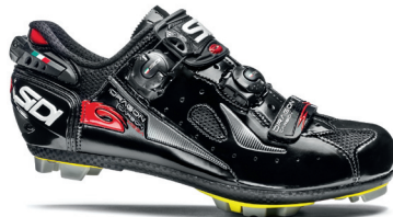
BLACK | BLACK