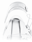
SOFT INSTEP 3

-- E' un cinturino posizionato sul collo del piede, sagomato, morbido e anatomico accoppiato con un materiale soffice per maggior comfort. Distribuisce la pressione in modo omogeneo sul collo del piede e si regola su entrambi i lati per avere una posizione perfettamente centrata del cinturino a seconda che il collo del piede sia basso o alto. Il sistema elimina la necessità di usare un distanziale. SOFT INSTEP è sostituibile.