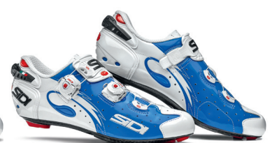
BLUE | WHITE