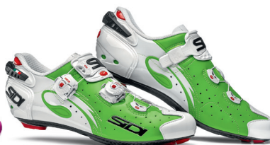
GREEN FLUO | WHITE