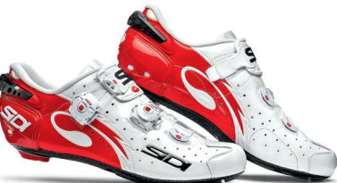
WHITE | RED