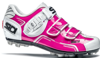
WHITE | WHITE