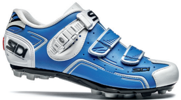
BLUE | WHITE