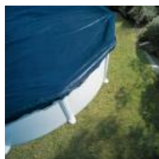
Cubierta de invierno Winter cover CIPR451