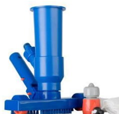
Limpiafondos Ventury Ventury vacuum 90111